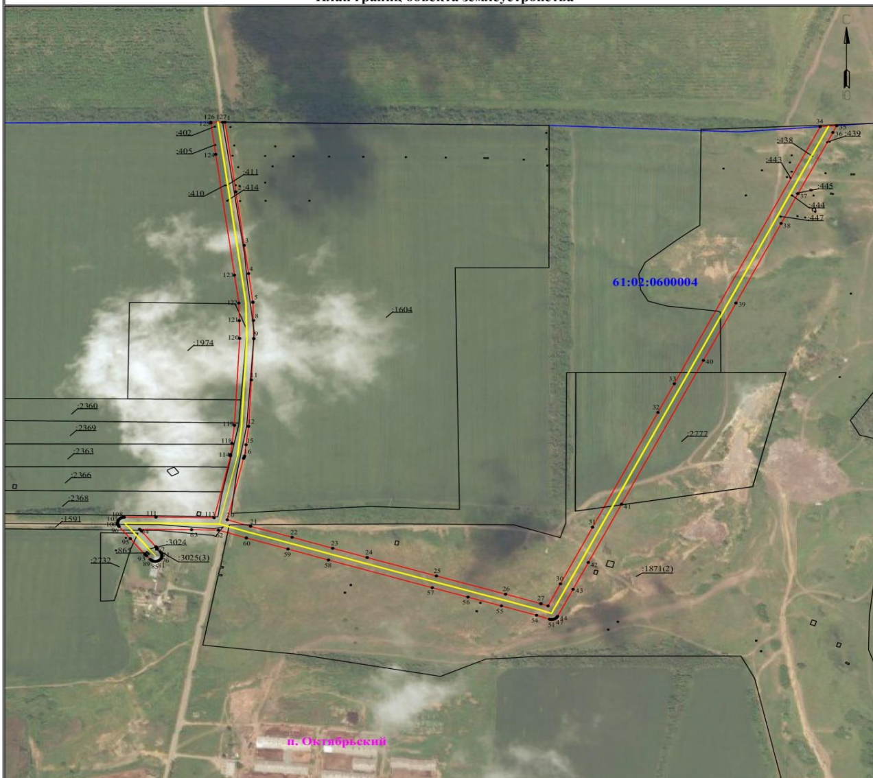
Схема расположения границ публичного сервитута для размещения объекта ВЛ-10 кВ ВЛ-1203 ПС АС-12 5,35КМ (наименование объекта землеустройства) План границ объекта землеустройства